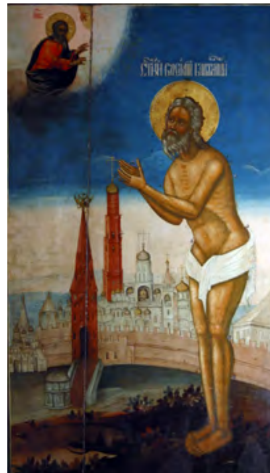
Икона «Св. Василий Блаженный». Первая половина XVIII в. Фрагмент. ГИМ