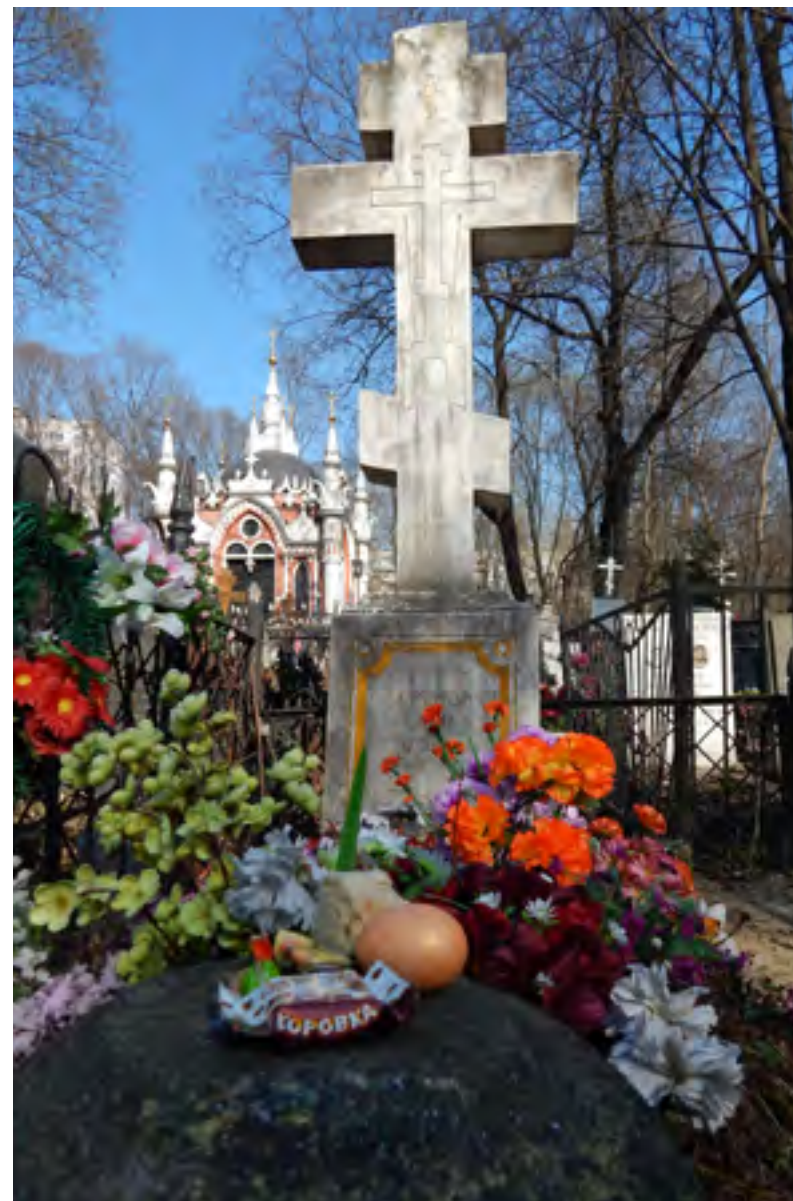
Мои́ла блаженнаго Иоанна Козмича на Преображенском кладбище. Пасха 20 апреля 2014 г.

Житие Иоанна Козмича продолжает традицию русских житий юродивых и включает большинство топосов, характерных для этого раздела агиографии. Подобные устойчивые формулы и образы были всесторонне проанализированы на обширном отечественном материале петербургской исследовательницей Т.Р. Руди 35 . К числу таковых в Житии блажен-