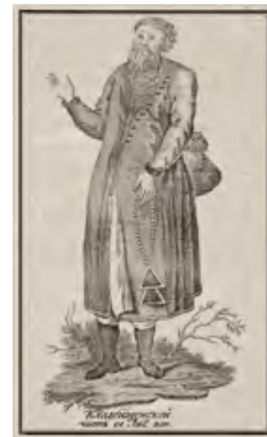
Изображение старообрядца-федосеевца («Кладбищенской»). Из книги А.И. Журавлева «Полное историческое известие о древних стригольниках и новых раскольниках» (СПб., 1795)