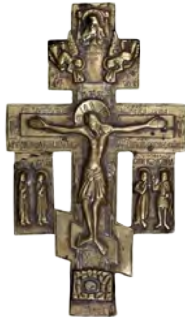
Крест Распятие с предстоящими. Переливка выговского креста с выполненной в литье «титлой» ИИЦ. Федосеевская мастерская. XVIII в.