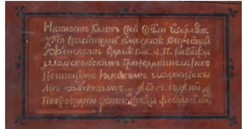
Надпись на обороте иконы «Господь Вседержитель»: «Написанъ бысть сей святыи образъ Христа Спасителя в Москвѣ в Преображенскомъ в домѣ господина Д.П. Казанцѣва московскимъ гражданиномъ и иконописцѣмъ Яковомъ Михайловымъ Жучковымъ 1813 года июня 4го по усердію грѣшнаго старца Феодосія Микитина»

Все источники сходятся в указании на выдающиеся художественные способности Иоанна: «иконописецъ номера