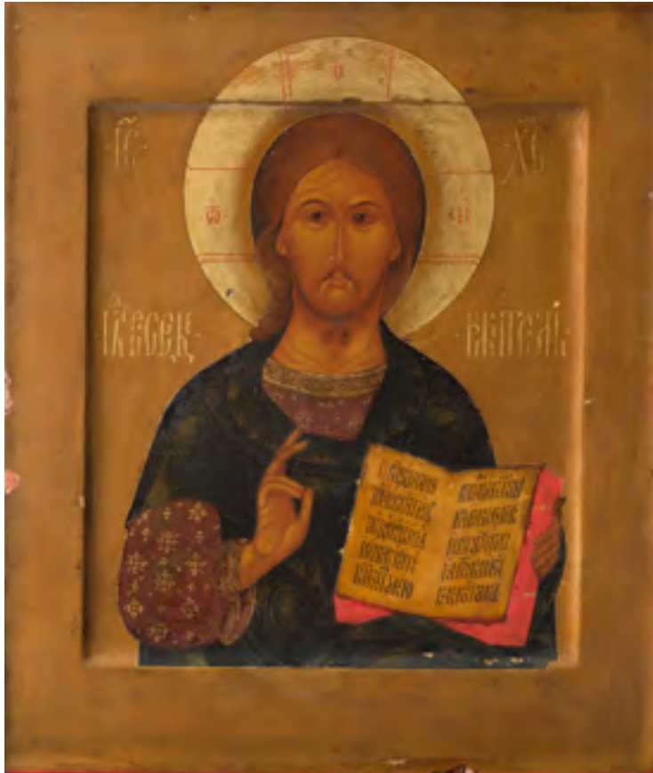
Икона «Господь Вседержитель». Старообрядческий иконописец Яков Михайлов Жучков. Москва, Преображенское. 1813 г. ГИМ

нее всего, речь идет о выходцах из Прибалтики): «В царствующем градѣ Москвѣ суще два брата единокровныя Михаил и Иоанн и сестра Евдокия, дѣти Козмины, уроженцы породы латышской, а вѣроисповѣданіем древлеправославнии христіянь» 8 .