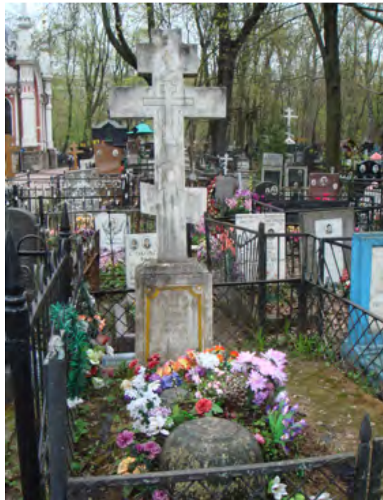
Могила блаженного Иоанна Козмича на Преображенском кладбище. Фото 2007 г.

Единственный на сегодняшний день список жития этого подвижника был обнаружен нами в архивных материалах Е.Е. Егорова: в объемистой (474 л.) канцелярской книге первой четверти XX в. самим собирателем в качестве дополнения