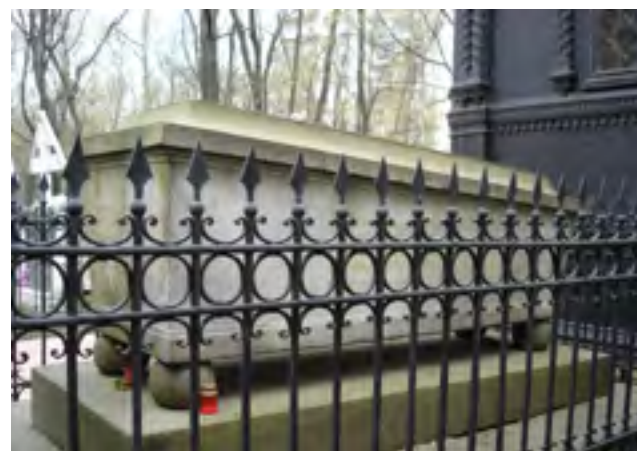
Часовня Креста Господня и Никольская часовня на Преображенском кладбище. Фото 2007 г.