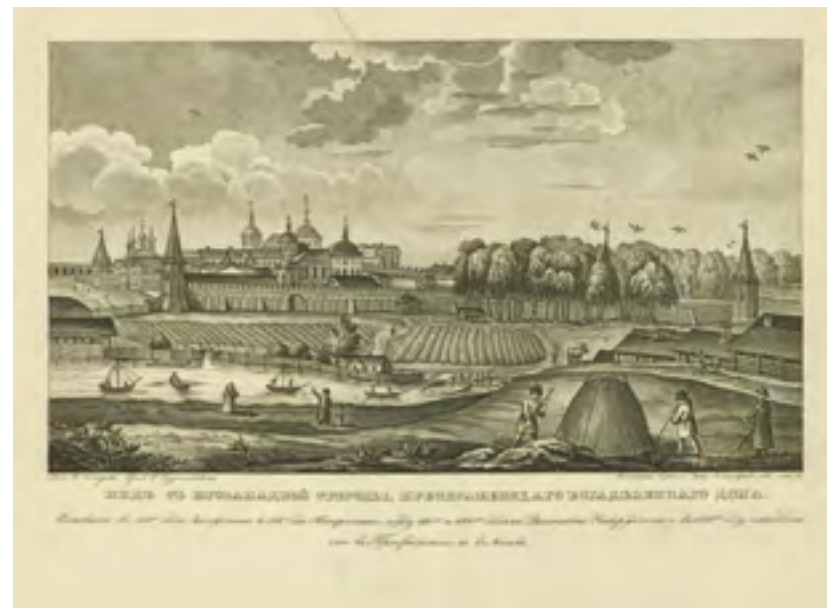
Вид с юго-западной стороны Преображенского богаделенного дома. Гравюра пунктиром Р. Курятникова. По рисунку П. Федорова. Москва. 1837 г.

Согласно Житию, блаженный Иоанн вел типичную для юродивого жизнь: претерпевал жару и холод, мок под дождем,