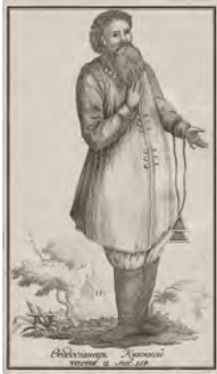
Изображение «федосеевца книжного». Из книги А.И. Журавлева «Полное историческое известие о древних стригольниках и новых раскольниках» (СПб., 1795)