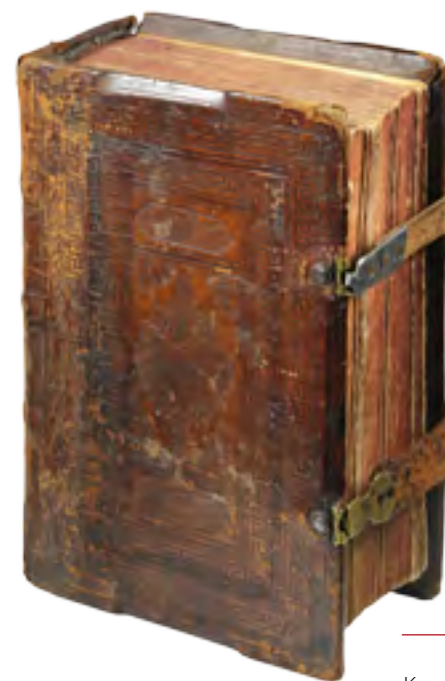
Красный устав. Общий вид книги. Стеклографированное издание. Москва. Ок. 1883 г. Собрание М.С. Бывшева

О многочисленных проявлениях чудесного дара пророчества и чудотворения, которым был наделен Иоанн, повествуется в Житии юродивого. Эти краткие рассказы о прижизненных предсказаниях и исцелениях, со ссылками на свидетелей, иногда названных по именам, объединены в главы: «О приходящихъ людяхъ къ блаженному Иоанну»,