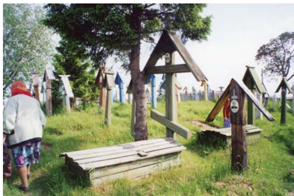
Рис. 1. Кладбище в с. Усть-Цильма.